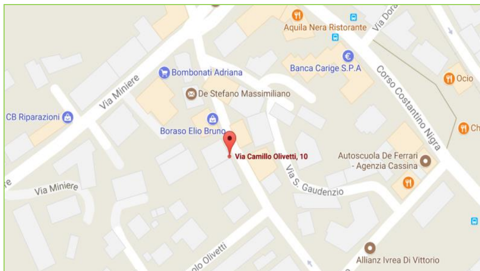
Mappa di Ivrea(TO)

lunedì - venerdì: dalle 10.00 alle 12.00 e dalle 15.00 alle 17.00