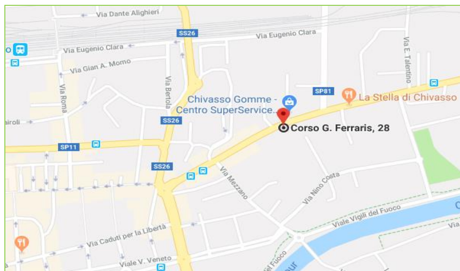
Mappa di Chivasso (TO)

lunedì: dalle 09.00 alle 18.00 martedì – giovedì: 09.00 – 13.00 venerdì su appuntamento