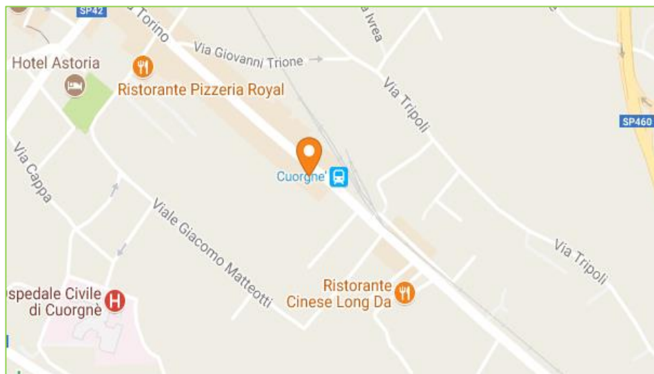
Mapa di Cuorgnè (TO)

lunedì - venerdì: dalle 10.00 alle 12.00 e dalle 15.00 alle 17.00